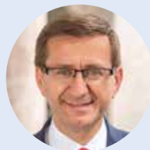
Markus Achleitner ZUSTÄNDIGE LANDESRAT

Wir sehen uns heute in Europa mit großen Herausforderungen konfrontiert, die für uns lange Zeit undenkbar waren: Eine weltweite Pandemie, Krieg in Europa und große, notwendige Transformationsprozesse – beispielsweise im Bereich der Energie. Um diese Herausforderungen zu lösen braucht es das gemeinsame Engagement. Nur ein geeintes Europa ist ein starkes Europa – und das beginnt in den Gemeinden und Regionen.